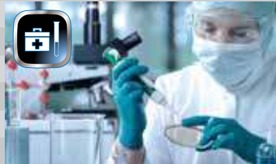
Pharmazie und Chemie